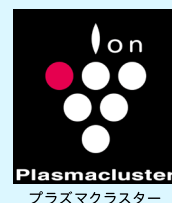
プラズマクラスター

上記の除菌システムに加え、車内浄化装置「シャープ製プラズマクラスター」イオン発生装置を設置しています。この装置にはウイルスを破壊し不活化する効果が認められております。(中型バス・マイクロバスには設置していません)